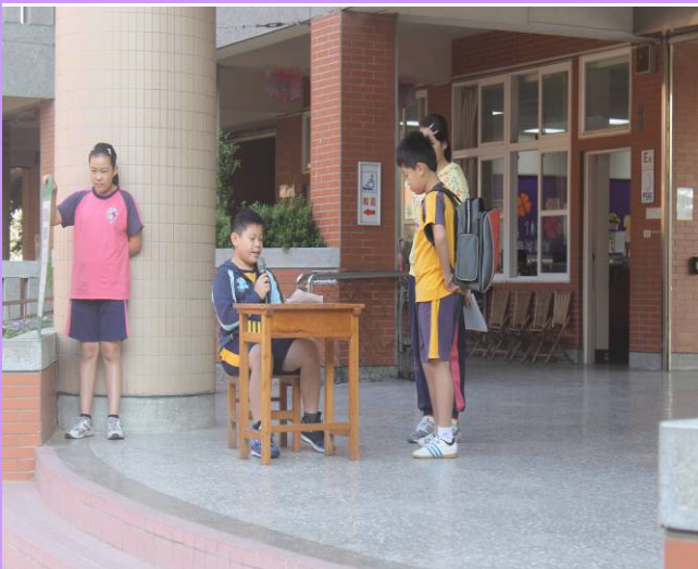
書包過重會影響學童的脊椎發展