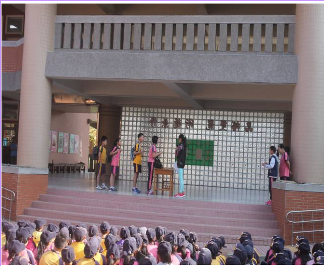
透過戲劇演出書包抽測的過程