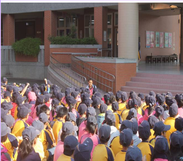
戲劇結束後進行有獎徵答