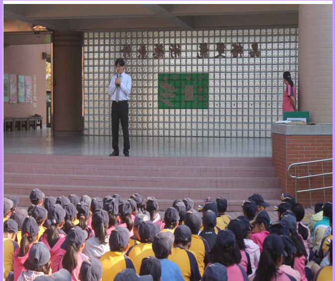
校長宣導書包減重的重要性