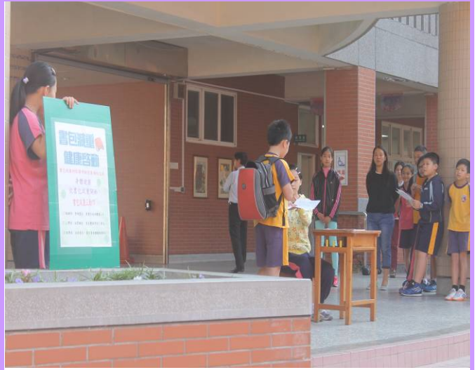
書包抽測不合格者會發下通知單