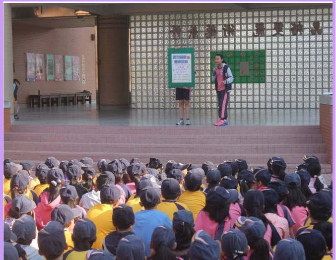
自治鄉長宣導落實書包減重三動作